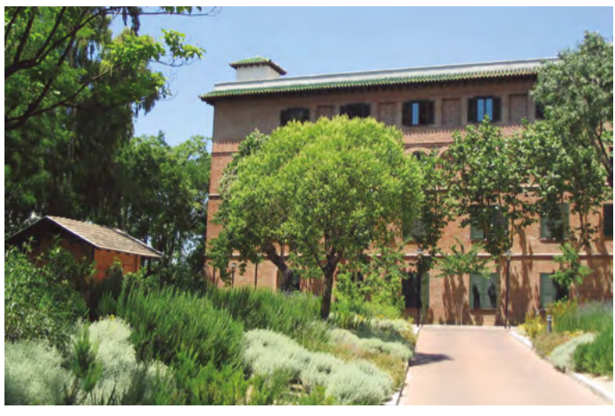
Entrada a la Residencia de Estudiantes por la calle Pinar, época actual.

1920. Sobre la misma loma, pero asomado al Paseo de la Castellana, se encuentra también el Museo de Ciencias Naturales (José Gutiérrez Abascal, 2), en cuya Sección de Entomología trabajó Luis Buñuel durante un tiempo.